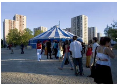
L'Espace Cirque d'Antony

Une programmation complète jusqu'en 2009 et plus de deux cents journées en 2006 durant lesquelles un chapiteau se dresse sur le site d'Antony pour accueillir des compagnies créatives autour d'un art réinventé en permanence : le cirque contemporain sous chapiteau. En constante progression, l'occupation confirme qu'un site comme celui-ci en région parisienne répond à un besoin tout à la fois géographique et artistique, à une époque où ce type d'espaces est de plus en plus rare.