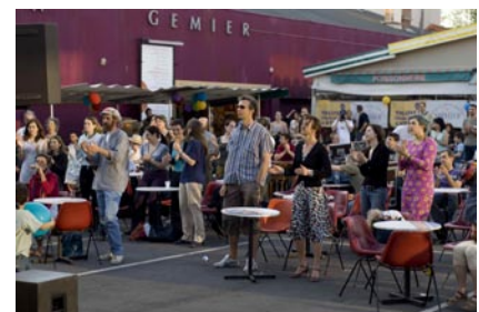
Le Théâtre Firmin Gémier

Le Théâtre Firmin Gémier / La Piscine est un équipement de la Communauté d'agglomération des Hauts-de-Bièvre. Il reçoit le soutien du Conseil général des Hauts-de-Seine, du Conseil régional d'Ile-de-France et des Villes d'Antony et de Châtenay-Malabry. Il est aidé par le Ministère de la Culture et de la Communication/Direction régionale des affaires culturelles d'Ile-de-France, au titre de scène conventionnée.